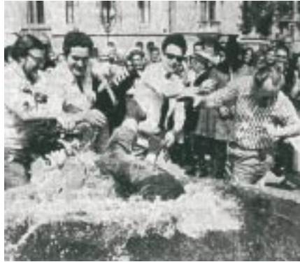
Gautschage à Ouchy. Les Compagnons n'y sont pas allés de main morte.

Celle-ci relevant de l'Eglise qui l'avait fondée ; les clercs étaient les enseignants.