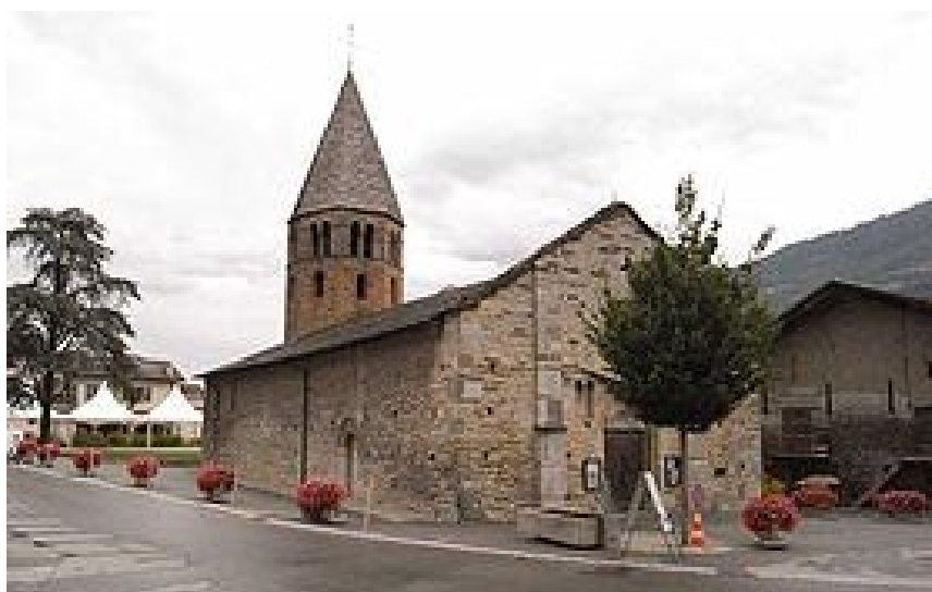
La magnifique église de Saint-Pierre-de-Clages, un édifice à visiter.