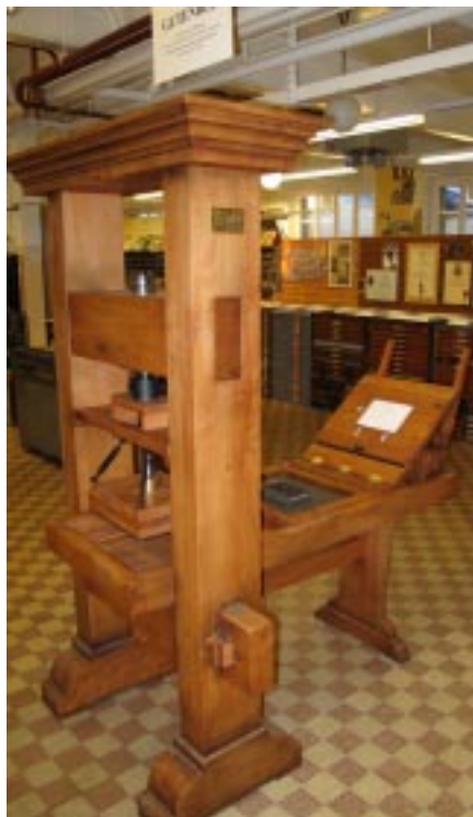
La réplique exacte de la presse de Gutenberg, fleuron de notre Musée.

Merci de vous adresser à l'Atelier-Musée Encre & Plomb. Tél. 021 634 58 58 ou info@encreplomb.ch